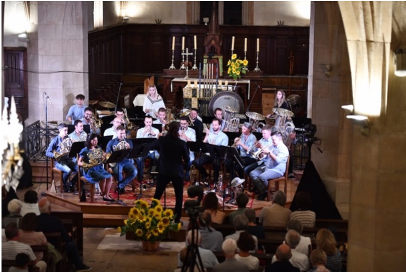
Kaléid Brass