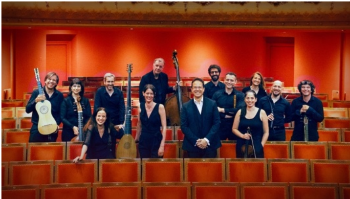
Cappella Mediterranea

Leur production s'inscrit dans le développement de la monodie accompagnée et du langage expressif propre au primo Seicento, où la rhétorique musicale, l'attention au texte et la recherche des affetti occupent une place centrale.