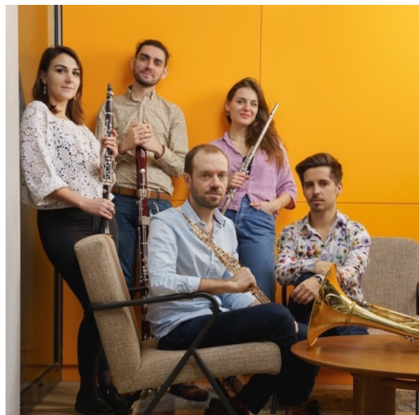
Quintette à Vents Linos

https://www.youtube.com/@QuintetteLinos/shorts